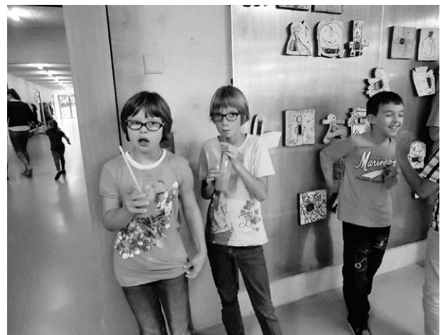
Der Powerdrink schmeckt sichtlich.