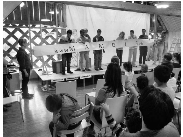
Eine Klasse stellt sich vor.

Rund 50 Lernende starteten das Schuljahr in der integrativen Sonderschulung im Schulkreis Willisau.