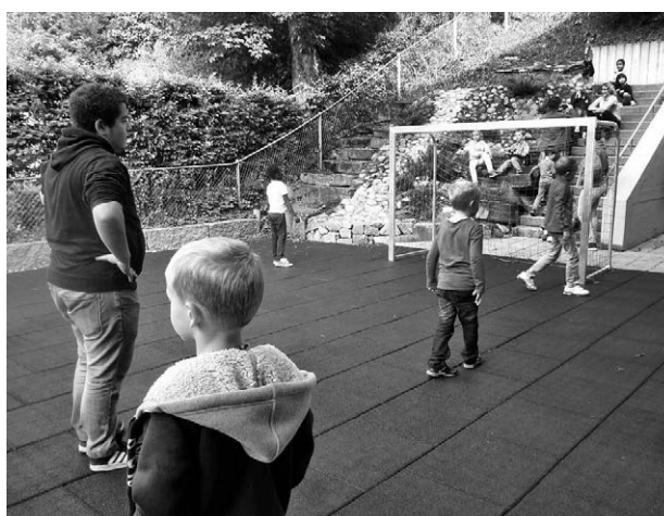
Gemeinsames «Tschutte» gefällt Gross und Klein.

Alle Aussagen bestätigen, dass mit dem rasch gewachsenen Vertrauen Gross und Klein den gemeinsamen Alltag im Schulhaus als bereichernde Erfahrung schätzen. Für die wohlwollende Zusammenarbeit aller danke ich an dieser Stelle herzlich.