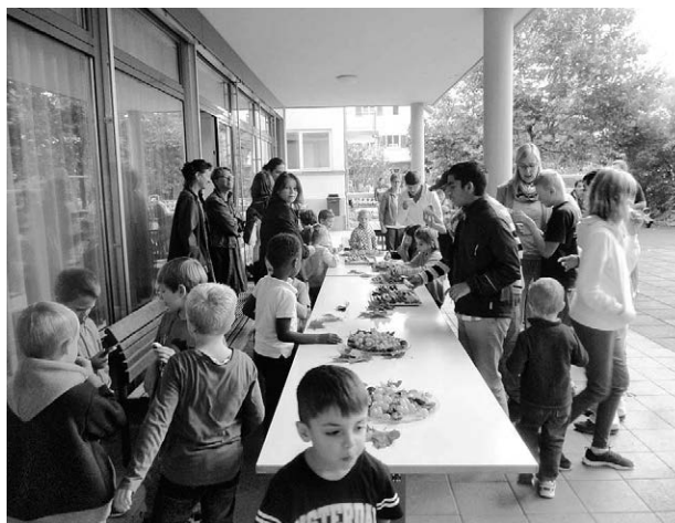
Im Schulhaus Schützenrain lädt die HPS zum Kennenlernznüni ein.