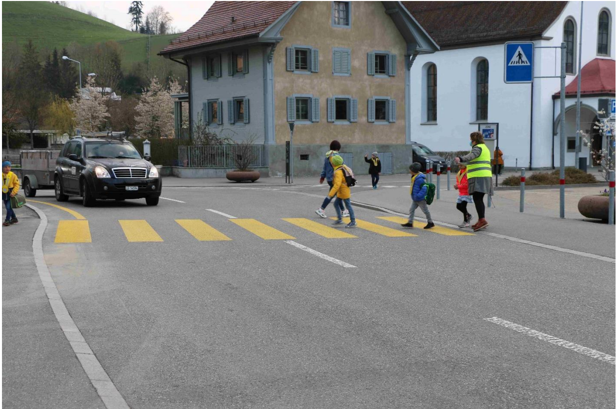
Kinder werden beim Überqueren der Strasse begleitet