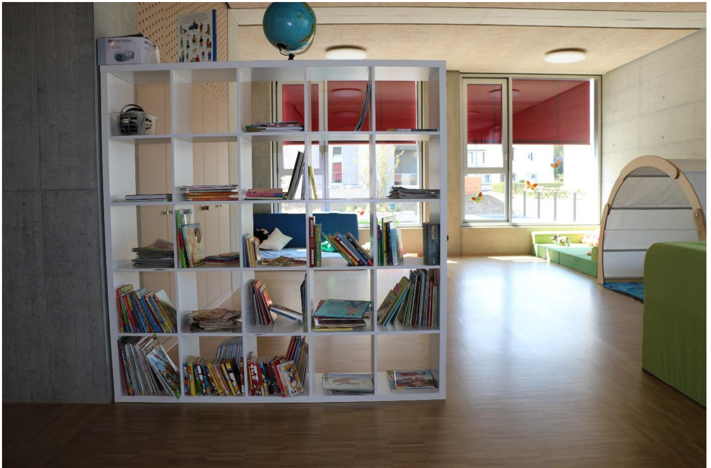
Ruheraum in der Tagesstruktur