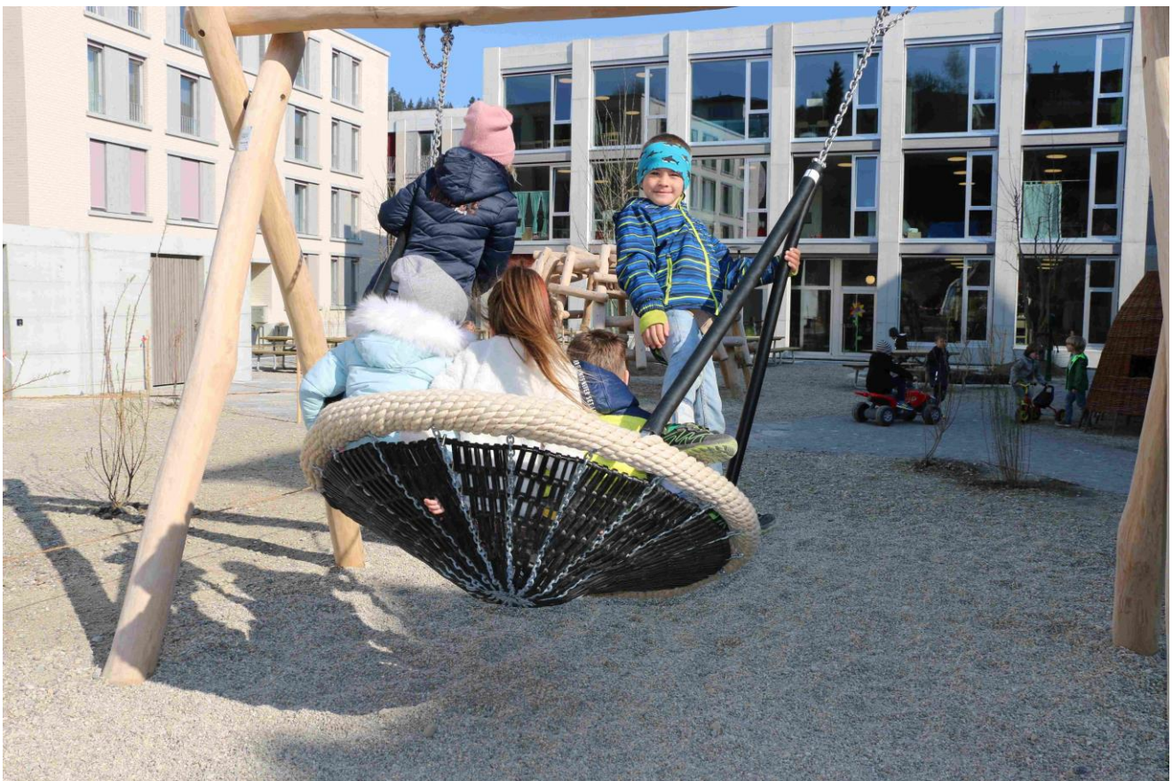
Belebter Pausen- Spielplatz