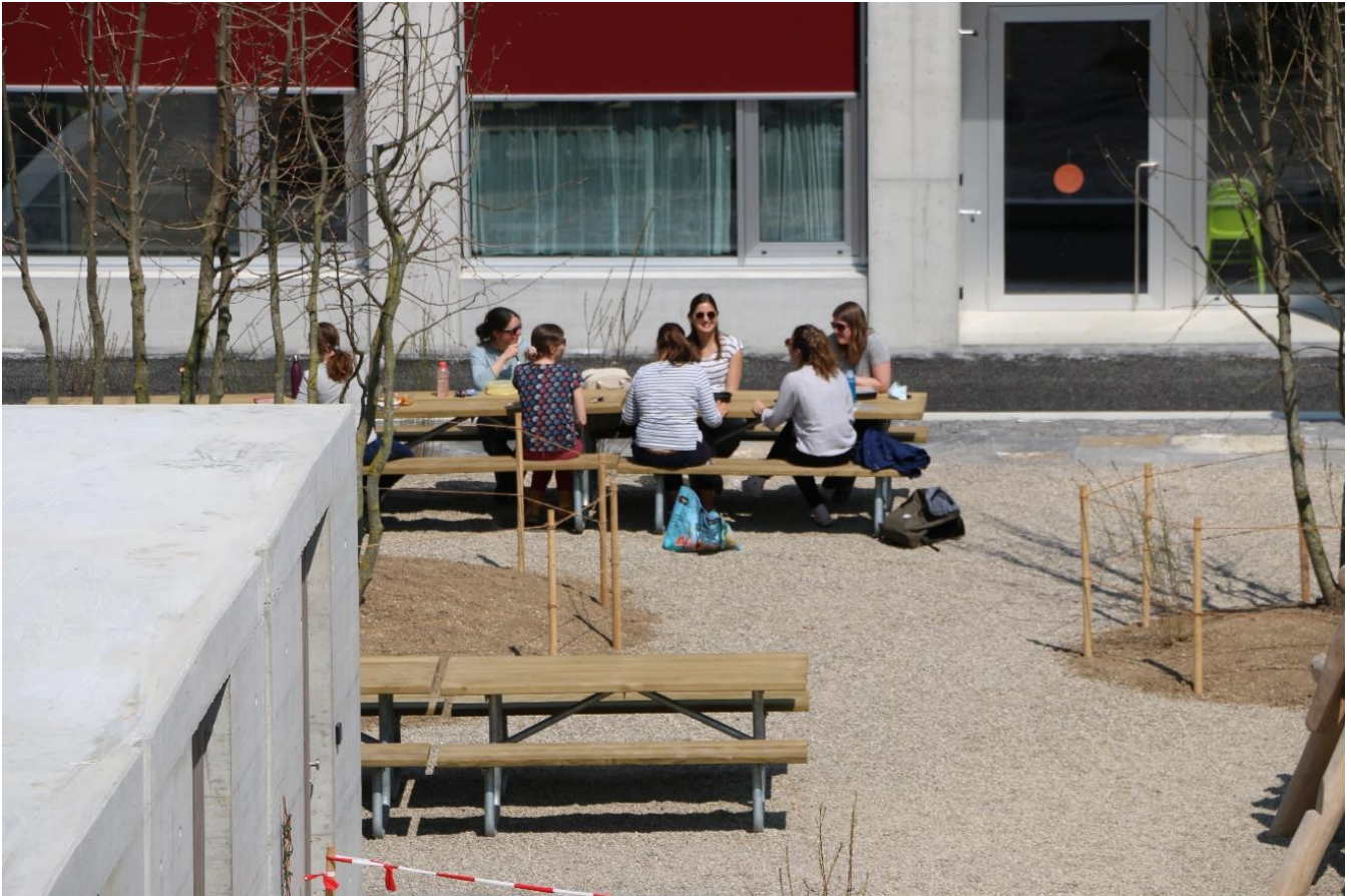
Kindergartenlehrpersonen beim Mittagessen beim Spielplatz

Zurzeit werden gut 80 Kinder in fünf Abteilungen unterrichtet. Im Haus ist Platz für sechs Kindergärten mit entsprechenden Zusatzräumen für Gruppen und Individualförderung vorhanden.