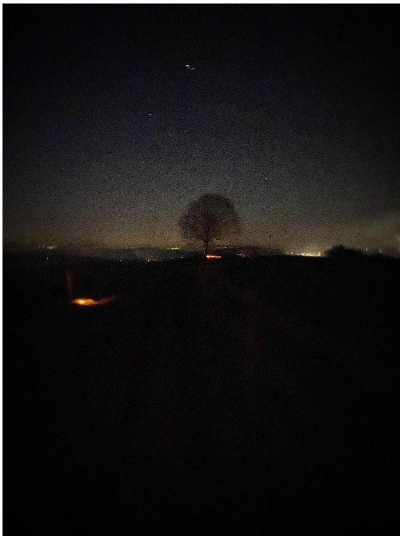
Aussichtspunkt Linde Schülen