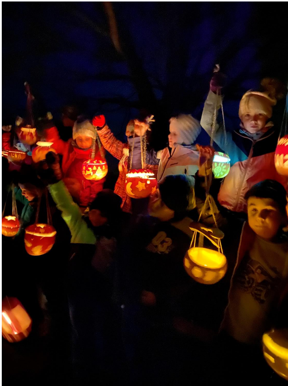
Konzert in der Finsternis